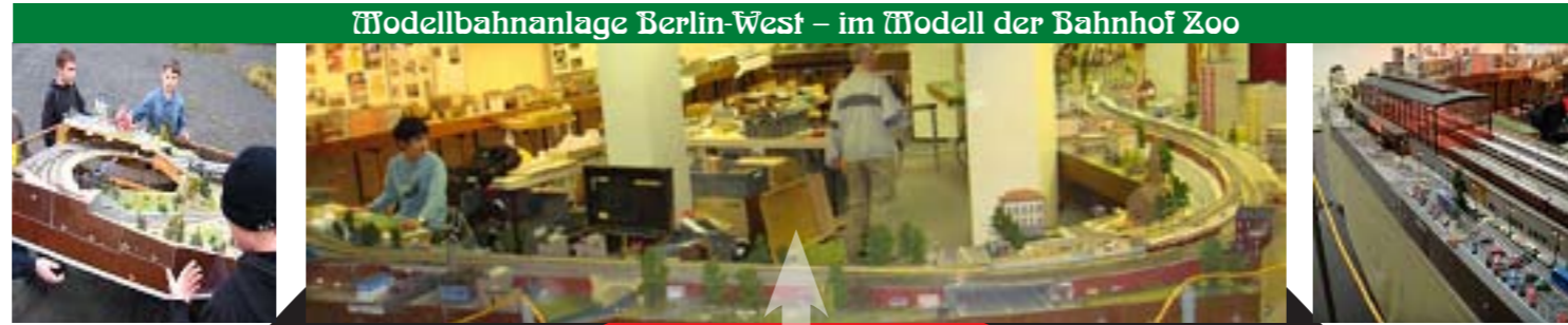
Modellbahnanlage Berlin-West – im Modell der Bahnhof Zoo

Auch künftig wird die permanente Weiterentwicklung des Modellbahnverbands in Deutschland e. V. vom Vorstand vorangetrieben.