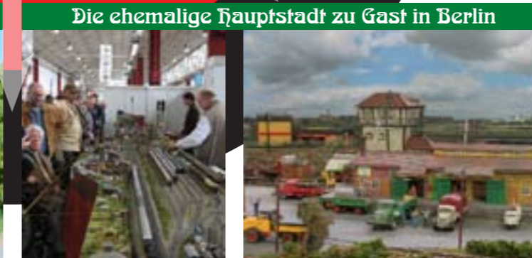
Die ehemalige Hauptstadt zu Gast in Berlin