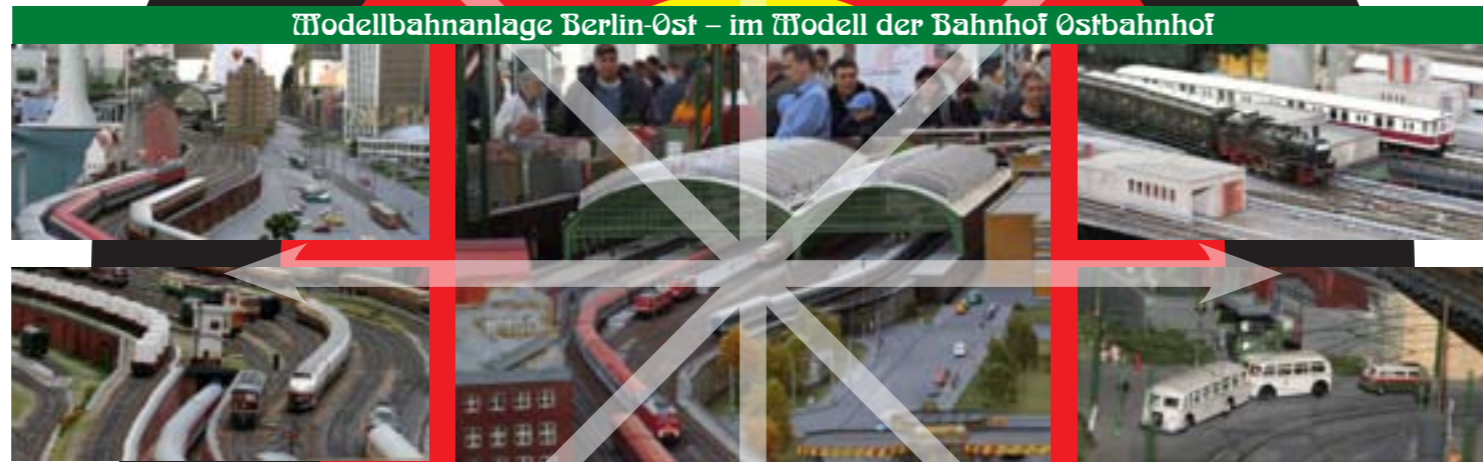
Modellbahnanlage Berlin-Ost – im Modell der Bahnhof Ostbahnhof